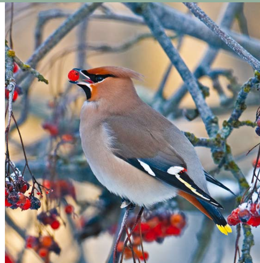
Tilhi • Bombycilla garrulus