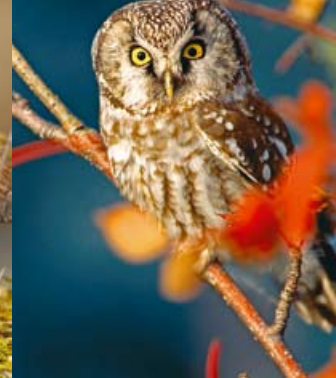
Helmipöllö • Aegolius funereus