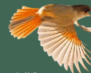
Kuukkeli • Perisoreus infaustus