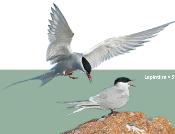
Lapintiira • Sterna paradisaea