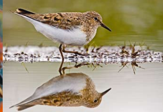
Lapinsirri • Calidris temminckii