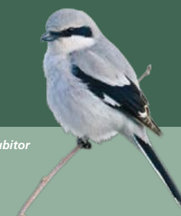
Isolepinkäinen • Lanius excubitor

Lisätietoja lappilaisesta lintuharrastuksesta sekä lajihavainnoista saat Lapin lintutieteelliseltä yhdistykseltä, www.lly.fi .