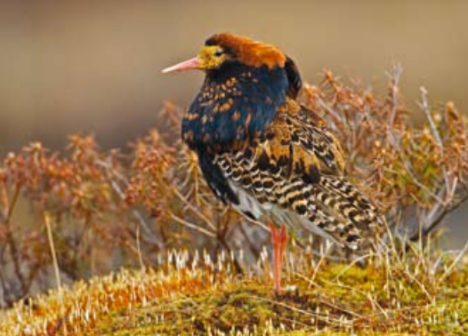
Suokukko • Philomachus pugnax