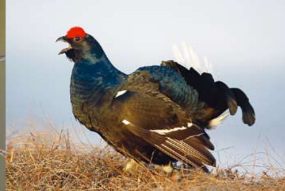
Teeri • Tetrao tetrix