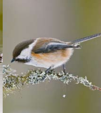
Lapintiaainen • Parus cinctus