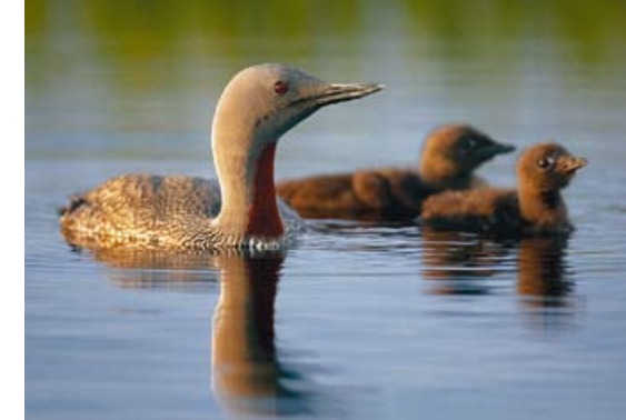
Kaakkuri • Gavia stellata