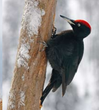
Palokärki • Dryocopus martius