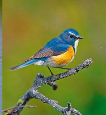
Sinipyrstö • Tarsiger cyanurus